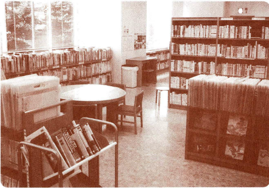
充実した児童書コーナー。大きな窓に面しています。

年7月のオープン以来、地区の生涯学習活動の拠点として、あかちゃんからお年寄りまで多くの住民に親しまれています。