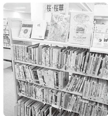
桜図書館 桜コーナー

資料は閲覧・貸出できます。桜区で桜を楽しんだ際は、ぜひ桜図書館へもお立ち寄りください。