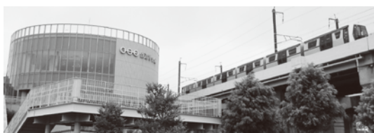
鉄道博物館と横を走る電車

大宮は1885(明治18)年の大宮駅開設後、乗降客数の増加とともに商人の進出などで駅前が整備され、商業都市の様相を見せるようになりました。また、日本鉄道会社大宮工場の設立や、鉄道輸送の便から製糸工場等が多く進出したことにより人口が増加、経済的にも著しい発展をとげました。このように鉄道を中心として街が発展していったことから、大宮は「鉄道のまち」と言われます。旧大宮市では1980年代から鉄道博物館の誘致構想があり、合併後のさいたま市へも引き継がれました。長い年月を経て、「鉄道のまち」に日本最大級の鉄道博物館が誕生したのです。