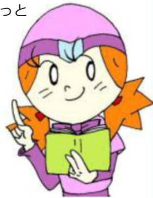
(画像は開発中のものです。)