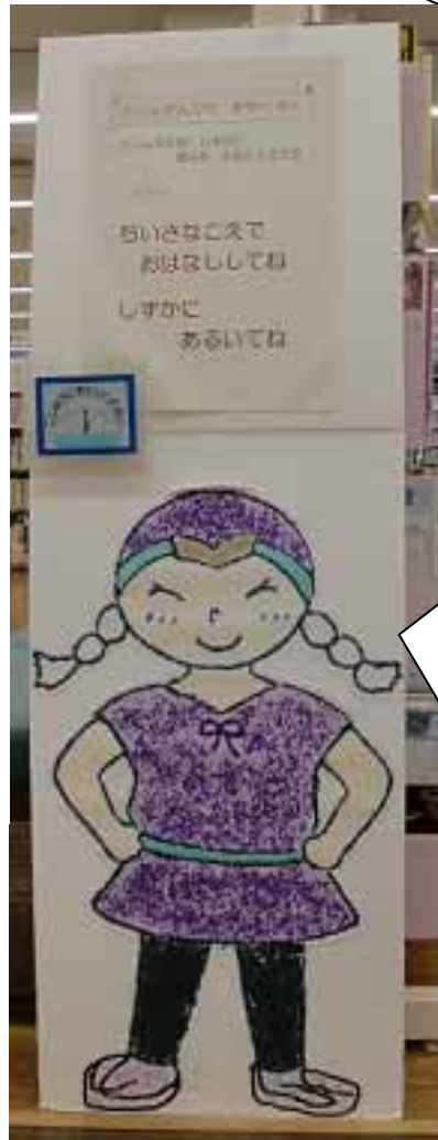
ひがしうらわ としょ丸 * 東 浦和図書館にいます

わたしとしょ丸で おてつだいでますー！ みんなに「としょ丸がどまもてほつてい」 をしらせているの。