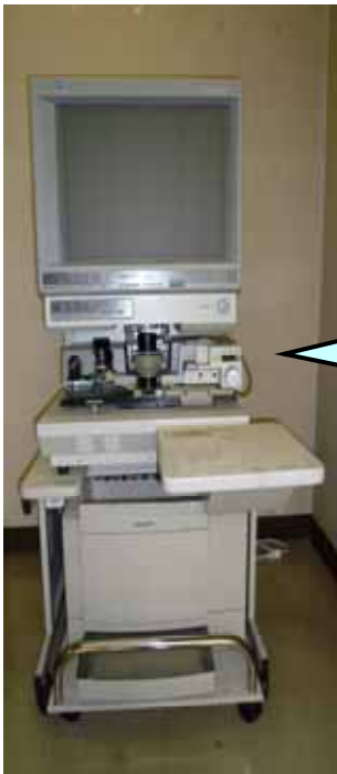
【マイクロ資料リーダー】