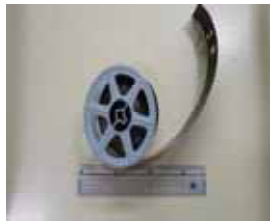
【マイクロフィルム】