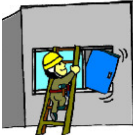
↑しゅうりはせんものひとにおねがいします。としまかんのひとではありません

としょかん 図書館は、できたばかりの新しい建物から、40年ぐらい前の建物まで、さまざま。しゅうりがひつようなところもおおいです。