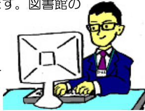
↑としまかんのひとだよ！

ほん かした 本の貸出しなどにひつような コンピューターなどのかんり をしています。図書館の ホーム ページの 作成もして います。