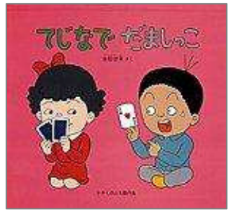
『てじなでだましっこ』 さえきとしお 著 福音館書店