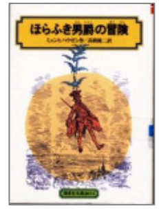
『ほらふき男爵の冒険』 ミュンヒハウゼン 著 たかほしけんじ 訳 偕成社

4月12日はパンの日で、 5月9日はアイスクリーム の日で、6月1日はチュー インガムの日で... そして6月4日からは、歯の えいせい週間。お兄ちゃん、 歯みがきはすすむぞー！