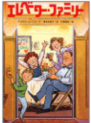
『エレベーターファミリー』 ダグラス・エバンス 著 やしまますみ 絵 清水奈緒子 訳 PHP研究所

そろそろ自分の部屋がほしいん だけど、としま丸くんは自分の 部屋をもってる？ ピーナッツさんより