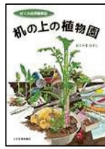
『机の上の植物園 ぼくの自然観察記』 おくやまひさし 作 しょうねんしゃしんしんぶんしゃ 少年写真新聞社