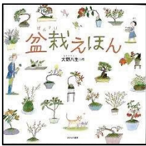
『盆栽えほん』 おの やよい さく 大野八生 作 あすなる書房