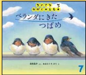
『ベランダにきたつばめ』 越智典子 文 おおたぐるまり 絵 福音館書店