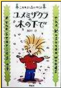
『ユメミザクラの木のつぼみ』 岡田淳 著 理論社