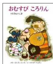
『おむすびころりん』 よだじゆんいち ぶん わたなべさぶろう え 偕成社