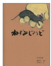
『ねずみじょうど』 瀬田真二 再話 丸木 位里 画 福音館書店

うんうん。おにぎりじゃな くて、そばもちの！ そば もちってぼく、食べたこと ないなあ。