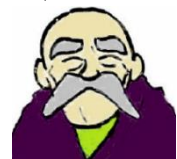
ろうし どうほつぬし 老師(道場主)

絵のなかに 8つのちがいが かくされておるぞ！ じっくり2つの絵を みくらべるのじゃ！ うおっふおっ ふおっ！